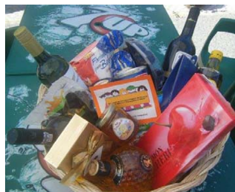
Cabaz da Páscoa