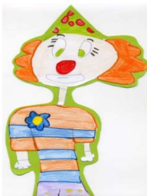
Desenho efectuado por aluno do 1º ano

As crianças tiraram fotografias com o Dr. Palhaço, e fizeram desenhos alusivos ao tema que foram expostos no Centro Comercial Sófarida (junto à